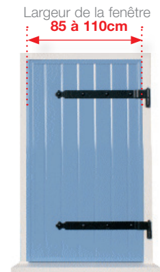
Un volet à 1 seul battant droit , poids maximum de 30kg