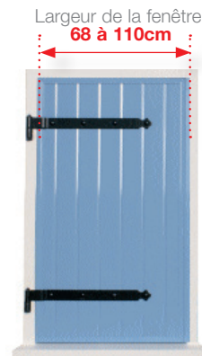
Un volet à 1 seul battant gauche , poids maximum de 30kg