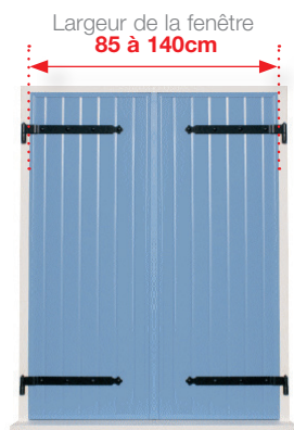
Un volet à 2 battants , poids maximum de 30kg par battant